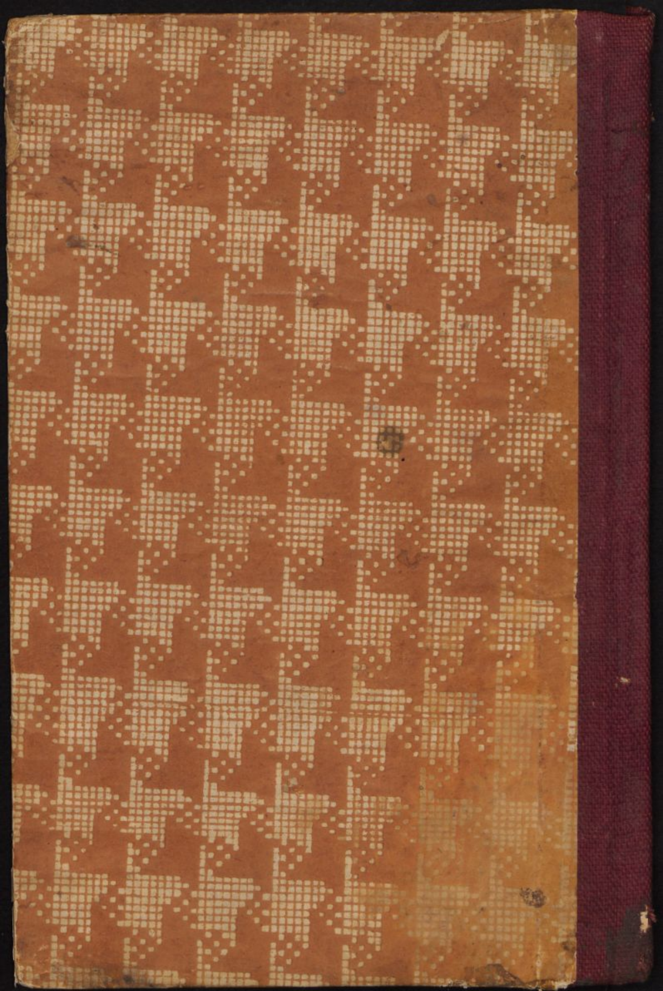
Harvard University - Middle Eastern Division, Widener Library, Harvard College Library / Na'im Allah Bahraychi, 1740 or 1-1803 or 4. Ma?mulat Mazhariyah va Mahbub al-?arifin. Lahur : Matba?-i Muhammadi, 1310 [1892]. ???? ???? ????????. ??????? ??????? ??????? ??????????. ?????? : ???? ??????. Widener Library, Harvard University, Cambridge, Mass.